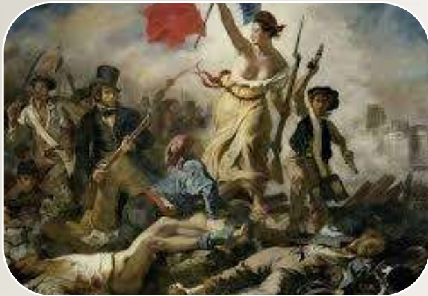
Revolución francesa 1789

Durante el siglo XVIII, se produjeron algunos procesos que cimentaron el pensamiento liberal del siglo XIX, los mas destacables estuvieron en torno al movimiento filosófico y político conocido como la ilustración.