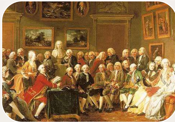
Movimientos ilustrados S. XVIII