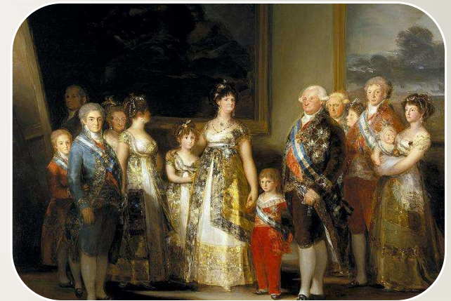
Crisis del sistema monárquico